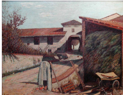
ANGELO COTTINO. Rivalta 6.4.1902. Giaveno 7.4.1968