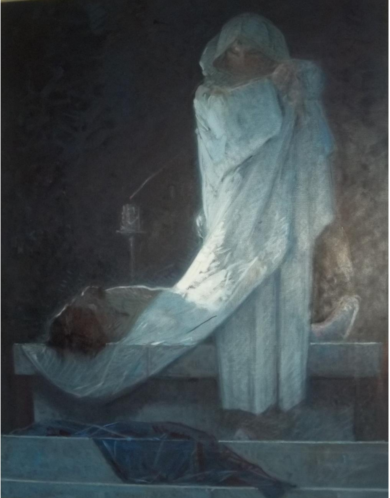
Ottavio Mazzonis, Ultima luce (XIV stazione Via Crucis)