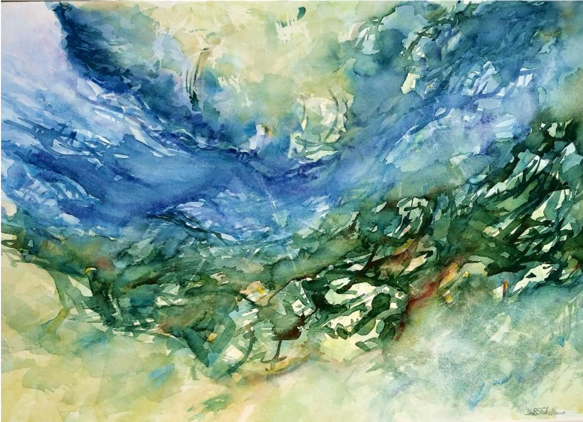
Rita Scotellaro, Elementali essenze

lo nacqui ogni mattina. / Ogni mio risveglio / fu come un'improvvisa / nascita nella luce: / attoniti i miei occhi / miravano la luce / e il mondo.