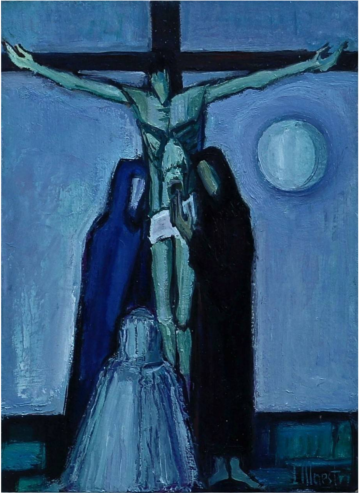
Laura Maestri, Crocifissione