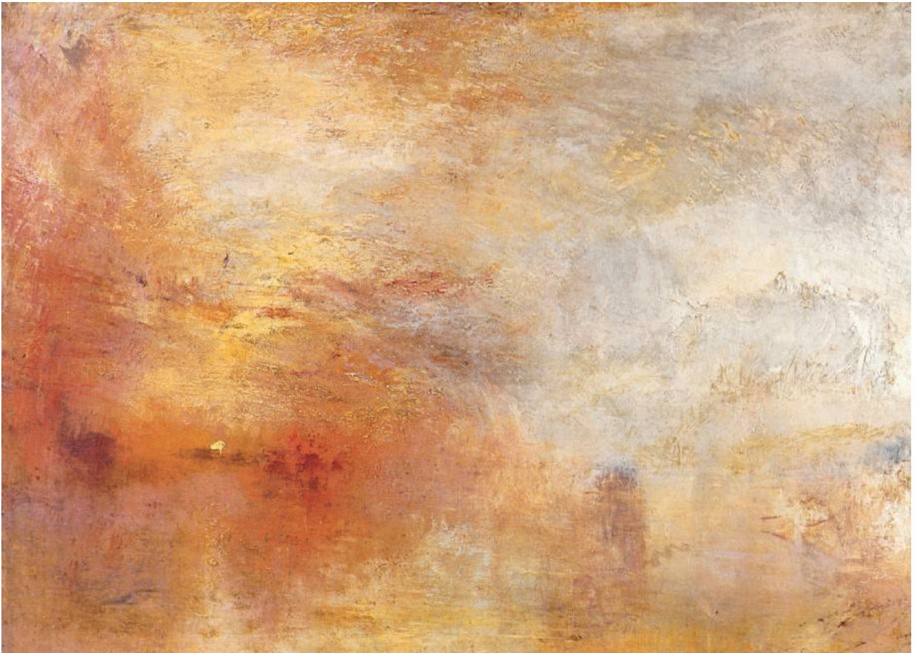
William Turner, Tramonto sul lago

Torquato Tasso, da Rime per Lucrezia Bentivoglio